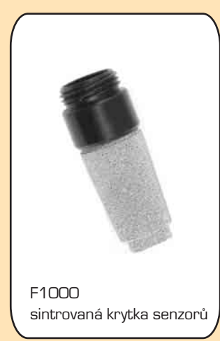
F1000 sintrovaná krytka senzorů