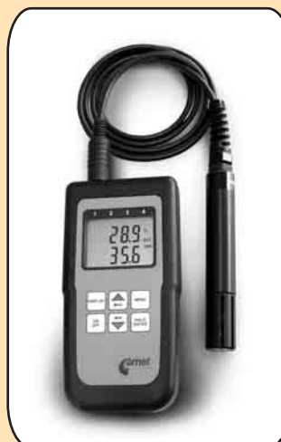
D3121, C3121 D4141, C4141