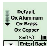
Výběr povrchu měření