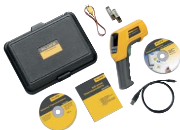
Fluke 568 a standardně dodávané příslušenství