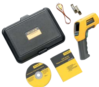
Fluke 566 a standardně dodávané příslušenství