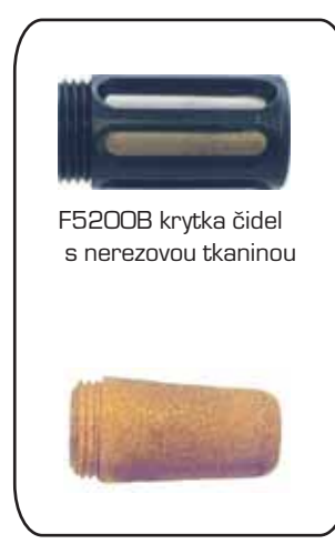
F5200B krytka čidel s nerezovou tkaninou