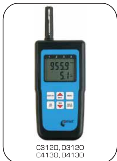
C3120, D3120 C4130, D4130