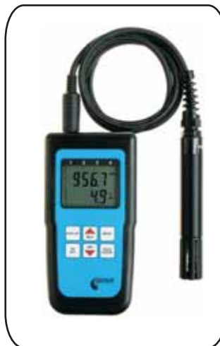
D3121, C3121 D4141, C4141