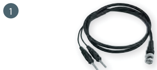
GMK 38 obj. č. 601261 měřicí kabel s konektory BNC a 2x banánek, ~ 90 cm dlouhý