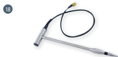
GSF 50TF (110 cm) obj. č. 601312