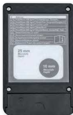
zadní strana přístroje