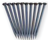
GST 91/40 obj. č. 601275 ocelové hřeby 10 ocelových hřebů v plast. dóze, Ø 2,5 mm, délka 40 mm