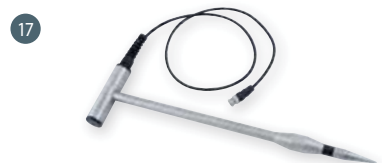
GSF 50 (110 cm) obj. č. 601306