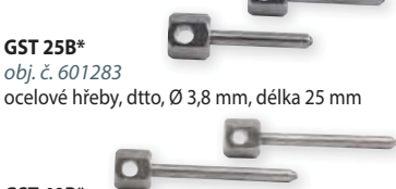
GST 25B* obj. č. 601283 ocelové hřeby, dtto, Ø 3,8 mm, délka 25 mm