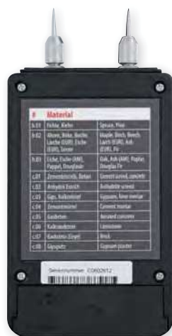
zadní strana přístroje