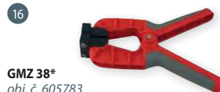
GMZ 38* obj. č. 605783 měřicí kleště pro měření dých a slabých výrobků ze dřeva (do tloušťky ~ 10 mm)