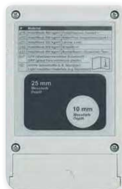
zadní strana přístroje